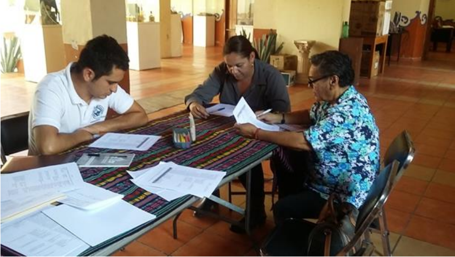
Imagen 2. Taller de retroalimentación para la elaboración del PMEAS CCC.