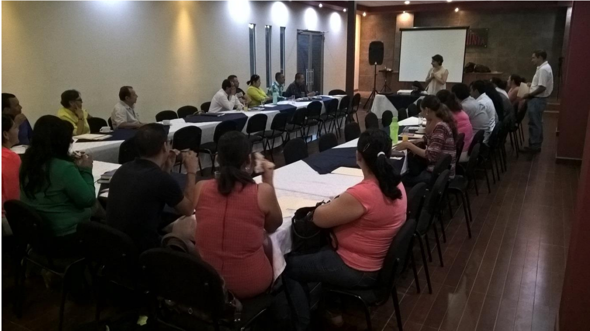
Imagen 1. Taller para la elaboración de Planes Municipales de Educación Ambiental para la Sustentabilidad, en Condiciones de Cambio Climático (PMEAS CCC).