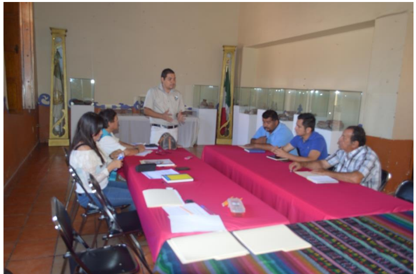
Imágenes 3 y 4. Mesas de trabajo para la elaboración del PMEAS CCC. Participantes: Dirección de Ecología, Turismo, Fomento Agropecuario, Agua Potable y Regidores de Educación y Ecología.