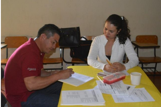
Mesa de trabajo. Instalaciones de la Casa de la Cultura, El Limón. 13 de Julio de 2017.