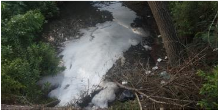
Contaminación Río El Salado

causa más probable de la mortandad de peces, podría ser una descarga extraordinaria con altas cargas de materia orgánica y sales, lo que ocasionó una reducción del oxígeno disuelto.