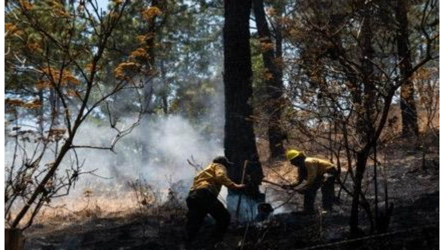
Combate de Incendios, ejido el Jazmín, municipio de San Gabriel