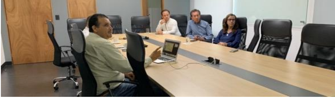
Presentación con personal de la CEA en Mayo 2023.