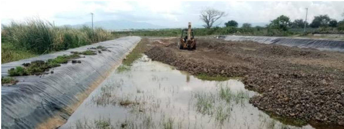
labores de rehabilitación. Labores de dispersión y nivelación. Julio 2023