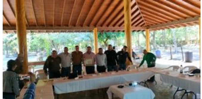
Sesión consejo de Administración de la JIRA.