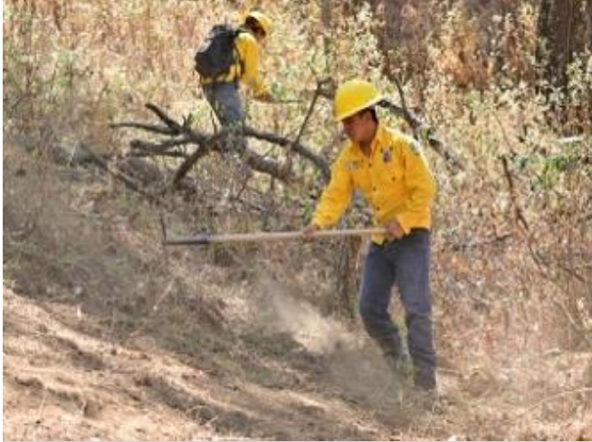
Actividades de prevención de incendios, en el municipio de San Gabriel.