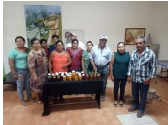
Taller de procesamiento de frutas