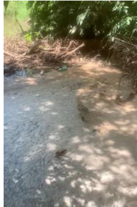
Contaminación Río El Salado