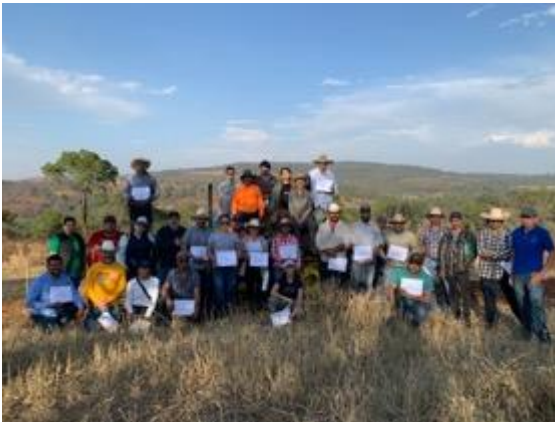
Taller de Key Line