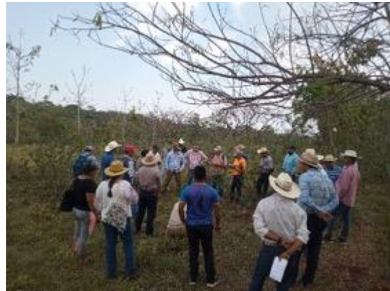
Intercambio de experiencias en Veracruz