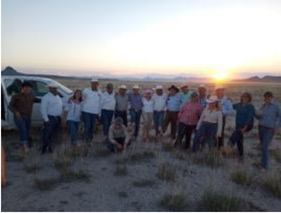
Recorrido de campo de la reunión de MRR