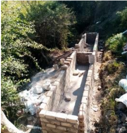
Biodigestor en construcción