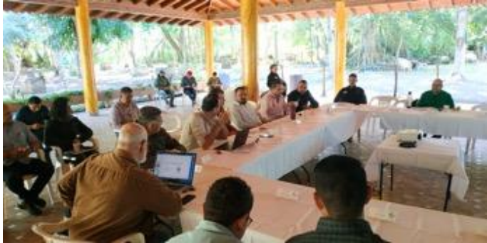
Sesión consejo de Administración de la JIRA