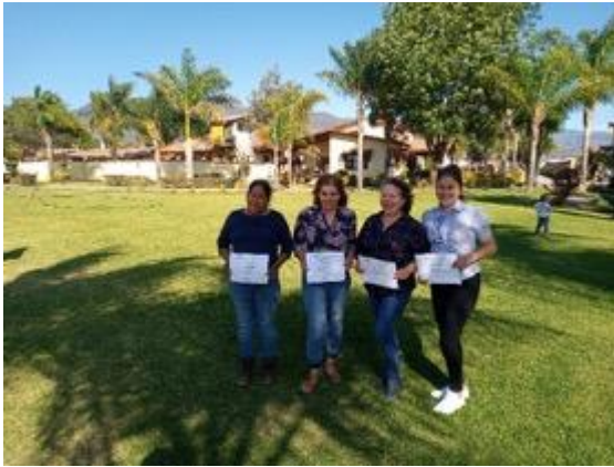
Intercambio de experiencias entre mujeres ganaderas

Se identifica también que estas actividades están permeando a productores que no asisten a las capacitaciones, pero al ver los resultados positivos en los que si asisten, comienzan a imitar su proceso productivo adoptando gradualmente algunas de la buenas prácticas que se trabajan en las escuelas de campo.