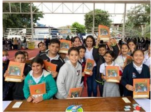
Feria ambiental, Aultán de Navarro