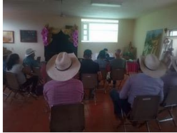
Reunión con ECA's de la región del Llano, para Presentar el reglamento de la carnicería.