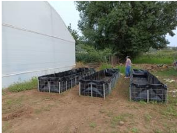
Camas de lombriz, composta en Unión de Tula