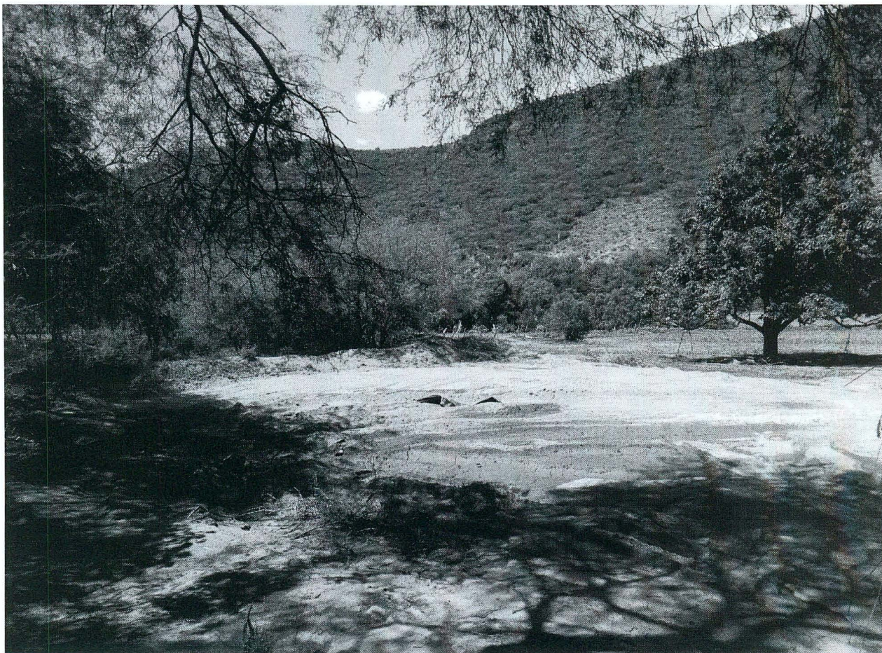
Area donde se pretende establecer el plantero para la producción de planta de agave.