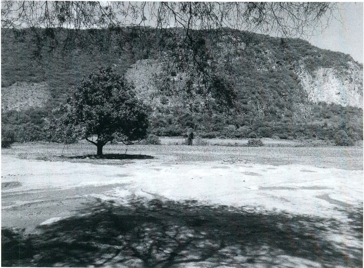
El área propuesta se ubica en la localidad de Montegrande y es una playa ubicada en los márgenes del Río Ayuquila.