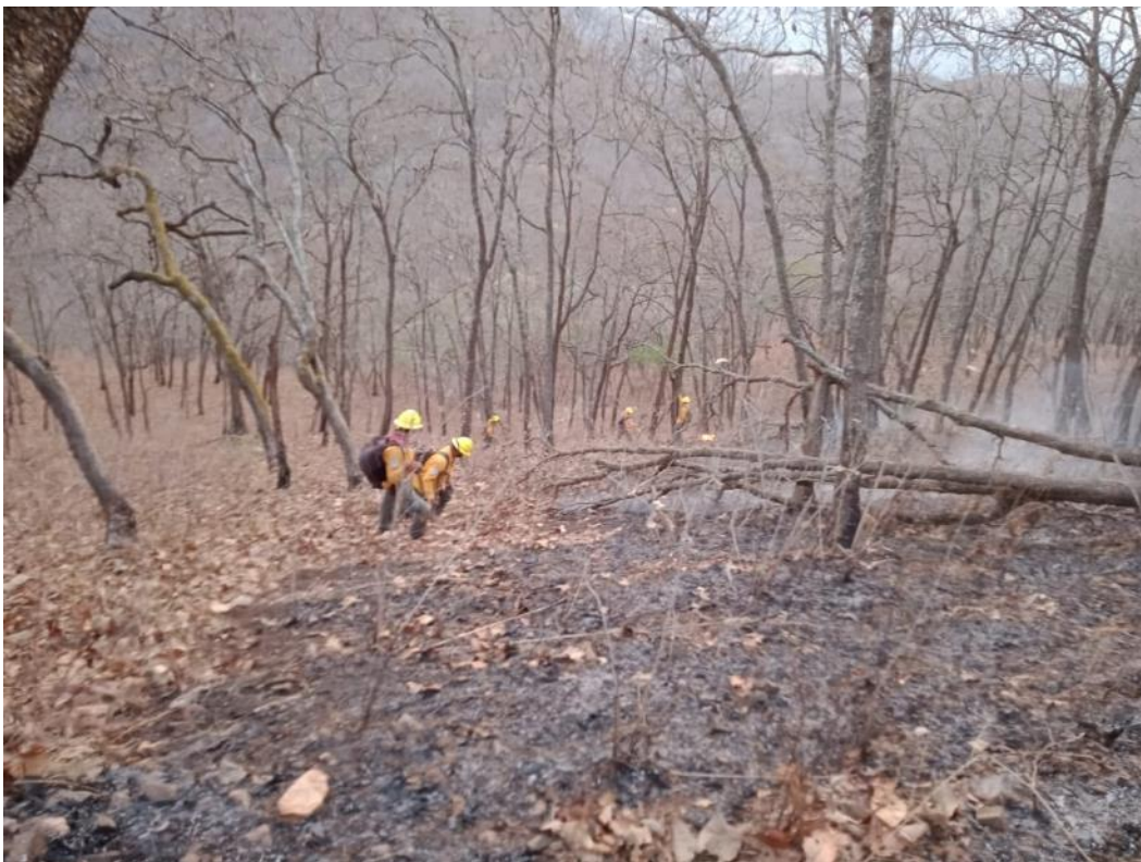
Brigada Regional de Manejo del Fuego JIRA-Valles en combate de incendios en el municipio de Ejutla, Jalisco.