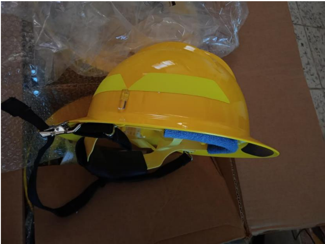
Equipo de protección especializado como parte del equipo de despliegue de la Brigada Regional de Manejo del Fuego JIRA-Valles.