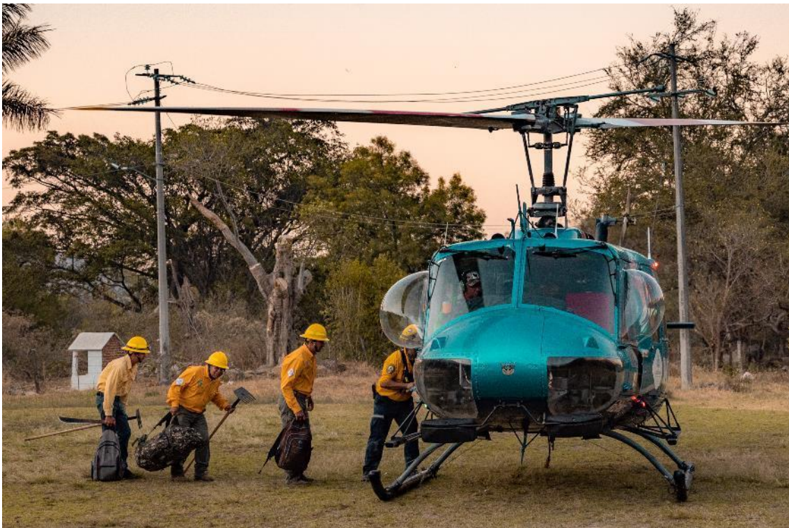
Brigada Regional de Manejo del Fuego JIRA-Valles abordando helicóptero para traslado a combate de incendio en el ANP Sierra de Manantlán