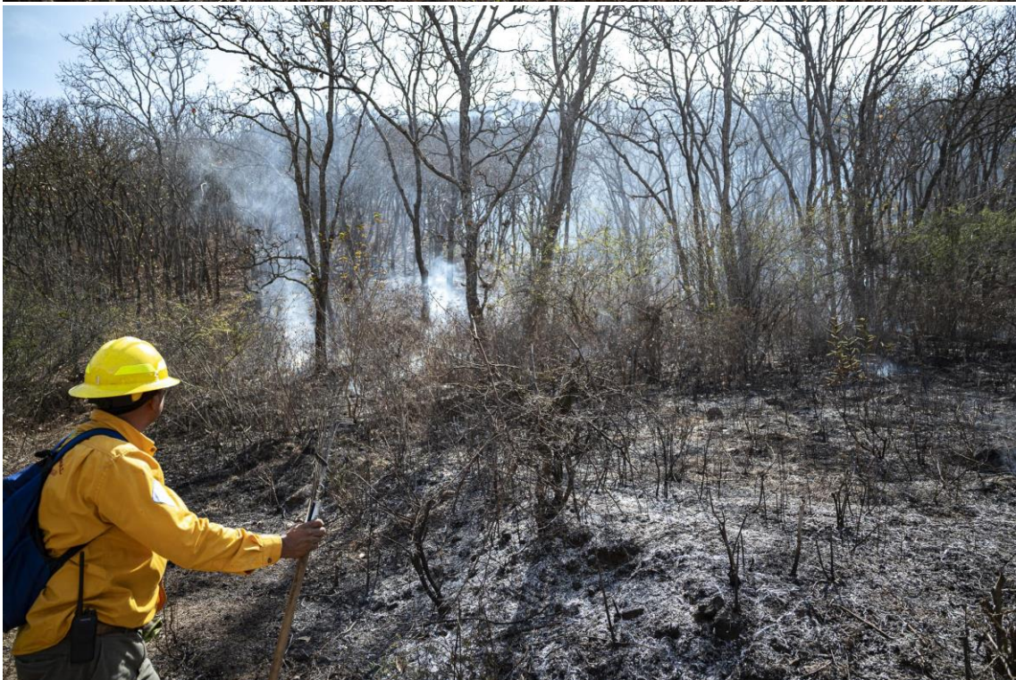
Brigada Regional de Manejo del Fuego JIRA-Valles en combate incendio dentro de la RB Sierra de Manantlán, municipio de Autlan de Navarro, Jalisco.