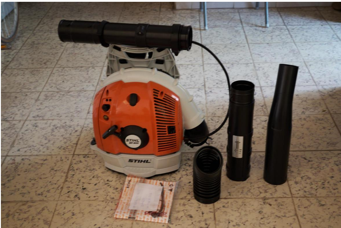
Equipo para realizar labores de prevención y combate de incendios forestales entregado a la brigada comunitaria del ejido La Laguna, municipio de Tolimán, Jalisco