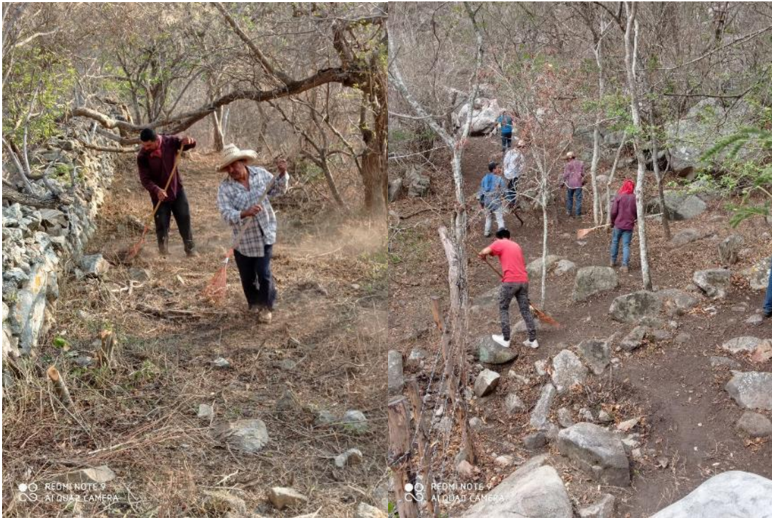
Personal del ejido Mezquites, del municipio de Tuxcacuesco, en labores de relimpia de brecha cortafuego durante la temporada de incendios forestales 2021