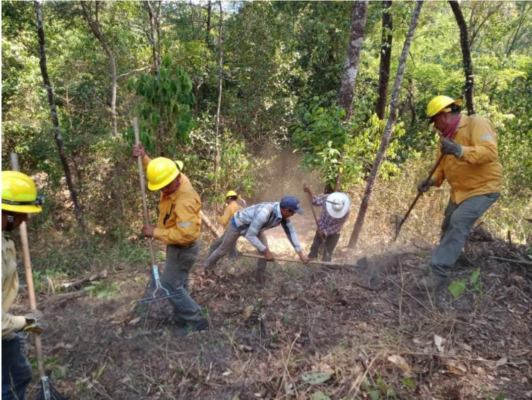
Brigada Regional de Manejo del Fuego JIRA-Valles y personal de la Comunidad Indígena de Cuzalapa construyendo brecha cortafuego para combate de incendio en el ANP Sierra de Manantlán