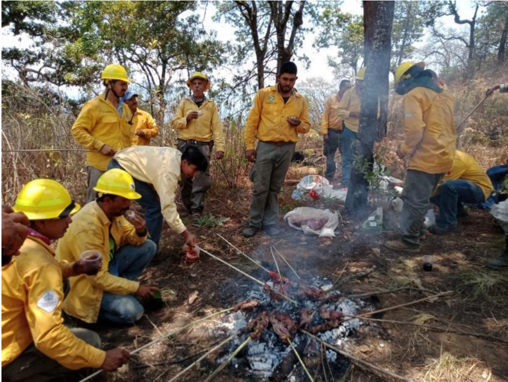
Brigada Regional de Manejo del Fuego JIRA-Valles compartiendo alimentos con elementos de la brigada de combate de incendios de la RB Sierra de Manantlán