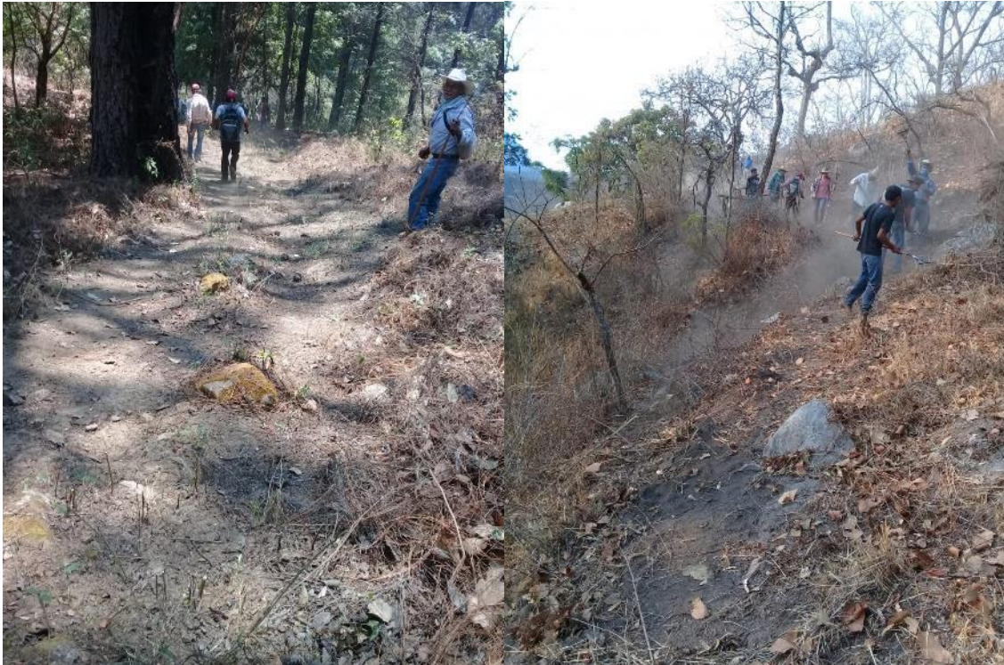
Personal del ejido El Rodeo, en el municipio de Tolimán, Jalisco, en labores de relimpia de brecha cortafuego durante la temporada de incendios forestales 2021