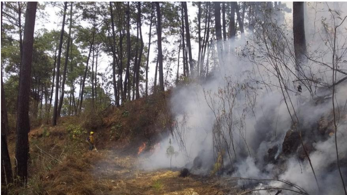
Brigada Regional de Manejo del Fuego JIRA-Valles en combate de incendio en la RB Sierra de Manantlán, municipio de Autlán de Navarro, Jalisco.