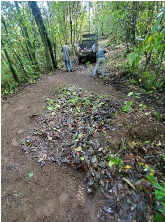
Personal del ejido San José del Carmen, en el municipio de Zapotitlán de Vadillo, en labores de relimpia de brecha cortafuego durante la temporada de incendios forestales 2021